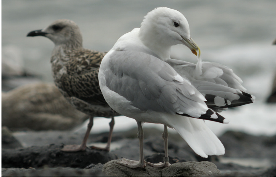
Figuur 13. Pontische Meeuw, adult, Westkapelle, 23 september 2010. Adult Caspian Gull at Westkapelle (The Netherlands), 23 September 2010. Kiev T 001380, ringed as chick near Kaniv (Ukraine) on 27 May 2004. (Theo Muusse).

Een vogel met oranje YH0.T is het derde voorbeeld van een Pontische Meeuw die zowel in Engeland als in Nederland is gezien. Hij werd op 22 oktober 2011 als eerste winter op de vuilstort van Rainham bij Londen geringd (ntgg.org.uk). Daarna zat hij op 15 en 29 december en op 12 januari en 2 februari 2012 op de vuilstort van Blaringhem in Noord-Frankrijk (180 km naar OZO). Vervolgens zat hij op 17 en 19 februari 2012 op Neeltje Jans (Fig. 14). Vier dagen daarna, op 23 februari, zat hij weer in Blaringhem (140 km ZW van Neeltje Jans) en hij werd hier ook gezien op 15 maart, op 28 juni, op 20 en 27 september en op 11 oktober. De omzwervingen maken tevens duidelijk dat vogels langs de kust korte tijd later ook in het binnenland kunnen worden gezien, en vice versa (de vuilstort bij Blaringhem ligt 40 km landinwaarts en geel PDPD was hier ook gezien).