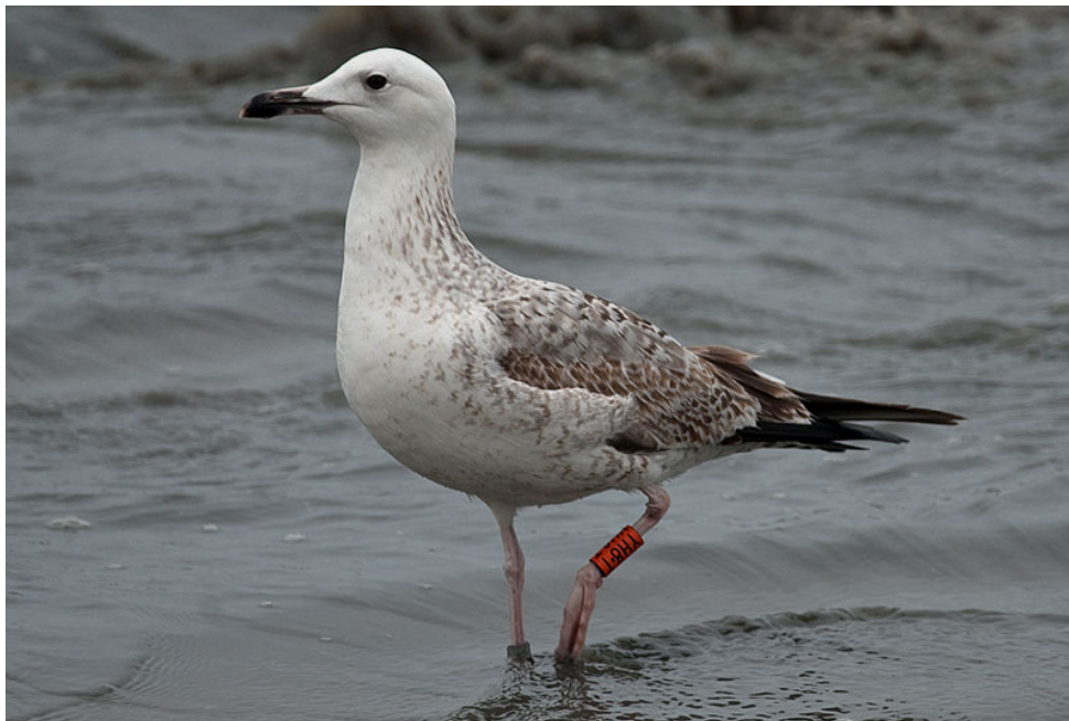
Figuur 7. Pontische Meeuw, eerste winter, Noordzeestrand Texel, 14 maart 2012. First-winter Caspian Gull at Texel (The Netherlands), 14 March 2012. Orange YH8.T (London GR 30473) ringed at Rainham Tip (Greater London, UK) on 17 December 2011.

daarop foerageerden grote aantallen meeuwen. Op Texel waren in het voorjaar van 2012 zandopspuitingen langs het Noordzeestrand. Dit trok grote aantallen meeuwen aan en hieronder bevonden zich ook Pontische Meeuwen. Bij de zandopspuitingen bij paal 29 werden er maximaal tien gezien (16 maart, 4 eerste winter, 2 tweede winter, 1 derde winter, 3 adult, Ruud van Beusekom). Bij de zandopspuitingen bij paal 11-12 werden er maximaal 13 gezien (5 mei, 7 eerste winter, 4 tweede winter, 2 derde winter, Rob van Bemmelen). Langs het strand van Texel werden in het voorjaar van 2012 zeker drie vogels gezien die in Polen waren geringd: op 25 februari een adult met groen AP75, op 9 mei een eerste winter met groen 59P0 (op 14 augustus in IJmuiden, Fig. 10) en op meerdere dagen een tweede winter met geel PDPD (zie hieronder). Een eerste winter met oranje YH8.T (Fig. 7) werd langere tijd op Texel gezien: op 11, 12, 14, 15, 16, 17 en 25 maart bij paal 29 en op 3, 5 en 6 mei bij paal 11-12. De vogel was op 17 december 2011 op de vuilstort van Rainham (bij Londen) geringd, 350 km WZW van Texel. Ook op 30 januari zat de vogel bij Rainham, maar op 31 januari zat hij bij Beddington (27 km WZW van de ringplaats). Deze vogel was dus al heen en weer naar Engeland gevlogen, want Pontische Meeuwen broeden niet op de Britse eilanden.