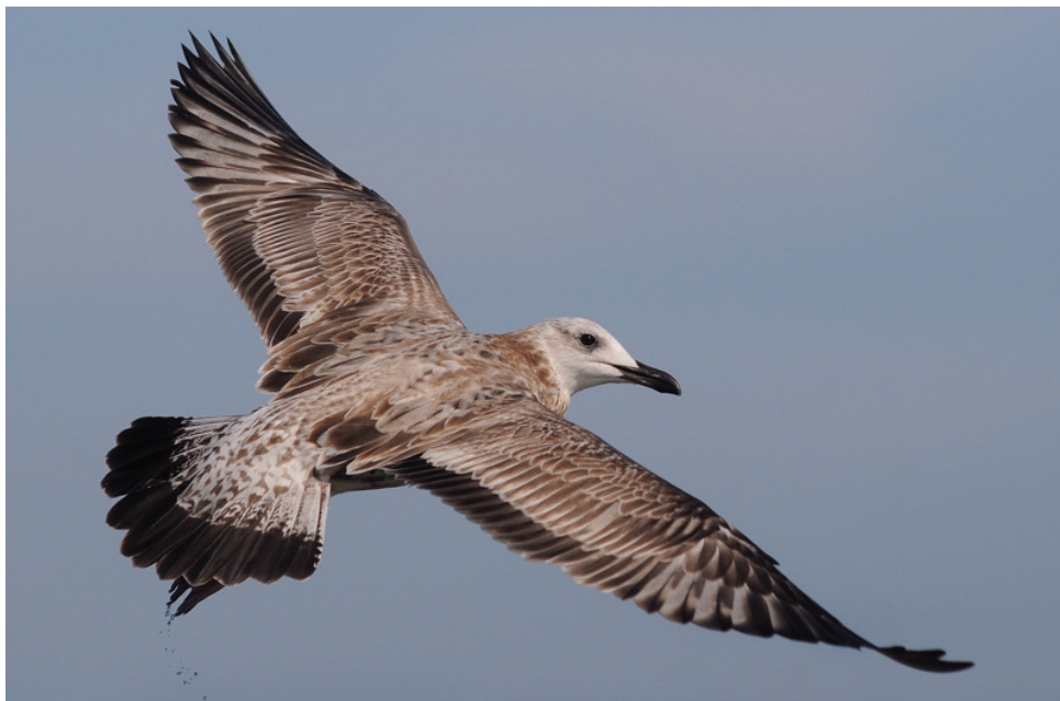
Figuur 3. Pontische Meeuw, eerste winter, Noordzee ten noorden van Ameland, 14 september 2008. First-winter Caspian Gull at the Dutch part of the North Sea, 14 September 2008, different bird as in Fig. 2.