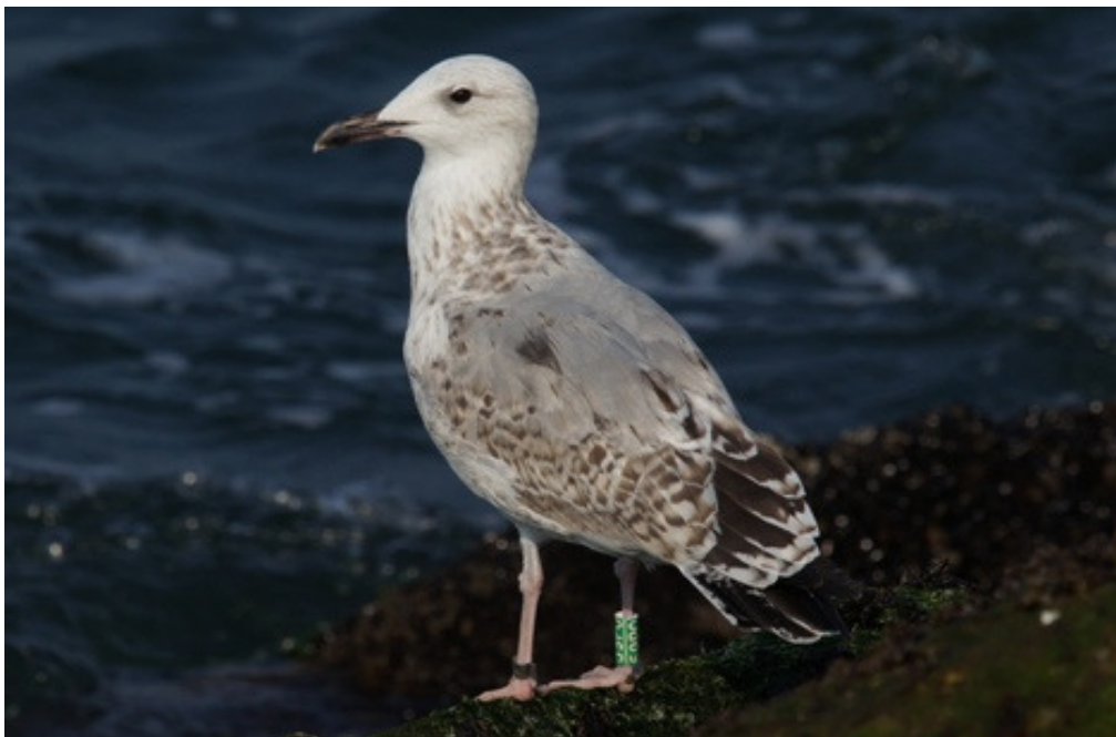
Figuur 10. Pontische Meeuw, tweede winter, IJmuiden, 14 augustus 2012. Second-winter Caspian Gull at IJmuiden (The Netherlands), 14 August 2012. Green 59P0 (Gdansk DN 20684) ringed as chick near Turek (52°00'N; 18°39'E, Poland) on 14 May 2011 (Roy Slaterus).