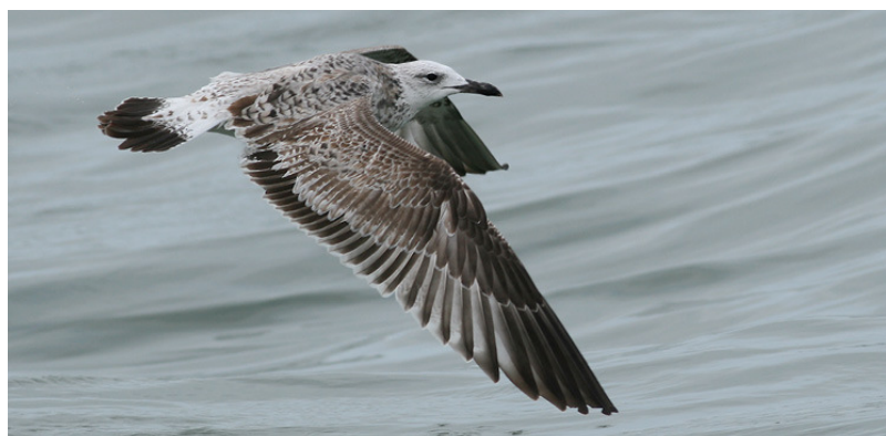
Figuur 4. Pontische Meeuw, eerste winter, Noordzee ten westen van Westkapelle, 29 september 2007. First-winter Caspian Gull at the Dutch part of the North Sea, 29 September 2007.