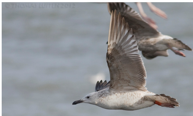
Figuur 14. Pontische Meeuw, eerste winter, Oosterscheldekering, 17 februari 2012. First-winter Caspian Gull at the Oosterschelde storm sudge barrier (The Netherlands), 17 February 2012. Orange YH0.T (London GR 15169) ringed at Rainham Tip (Greater London, UK) on 22 October 2011 (Thomas Luiten).

Een vogel met oranje YH0.T is het derde voorbeeld van een Pontische Meeuw die zowel in Engeland als in Nederland is gezien. Hij werd op 22 oktober 2011 als eerste winter op de vuilstort van Rainham bij Londen geringd (ntgg.org.uk). Daarna zat hij op 15 en 29 december en op 12 januari en 2 februari 2012 op de vuilstort van Blaringhem in Noord-Frankrijk (180 km naar OZO). Vervolgens zat hij op 17 en 19 februari 2012 op Neeltje Jans (Fig. 14). Vier dagen daarna, op 23 februari, zat hij weer in Blaringhem (140 km ZW van Neeltje Jans) en hij werd hier ook gezien op 15 maart, op 28 juni, op 20 en 27 september en op 11 oktober. De omzwervingen maken tevens duidelijk dat vogels langs de kust korte tijd later ook in het binnenland kunnen worden gezien, en vice versa (de vuilstort bij Blaringhem ligt 40 km landinwaarts en geel PDPD was hier ook gezien).