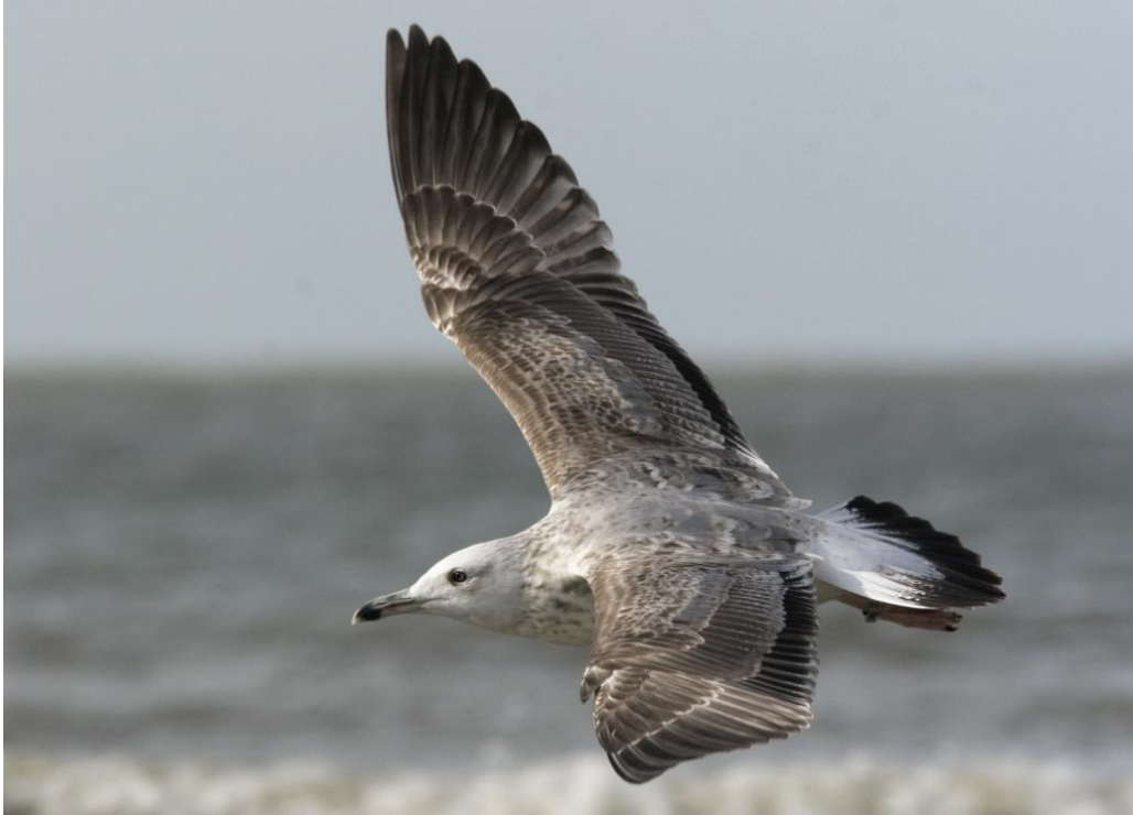
Figuur 9. Pontische Meeuw, tweede winter, IJmuiden, 9 oktober 2009. Second-winter Caspian Gull at IJmuiden (The Netherlands), 9 October 2009. Gdansk DN 24974 ringed as chick near Jankowice (Poland) on 22 May 2008 (Mars Muusse).