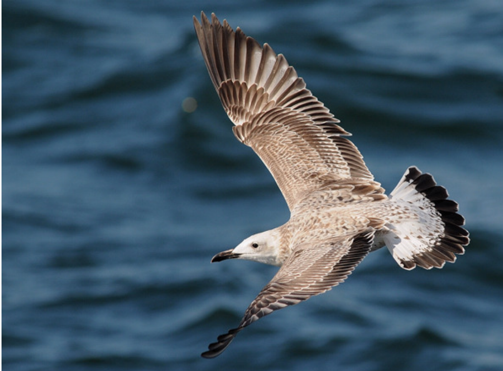
Figuur 2. Pontische Meeuw, eerste winter, Noordzee ten noorden van Ameland, 14 september 2008. First-winter Caspian Gull at the Dutch part of the North Sea, 14 September 2008 (Roef Mulder).