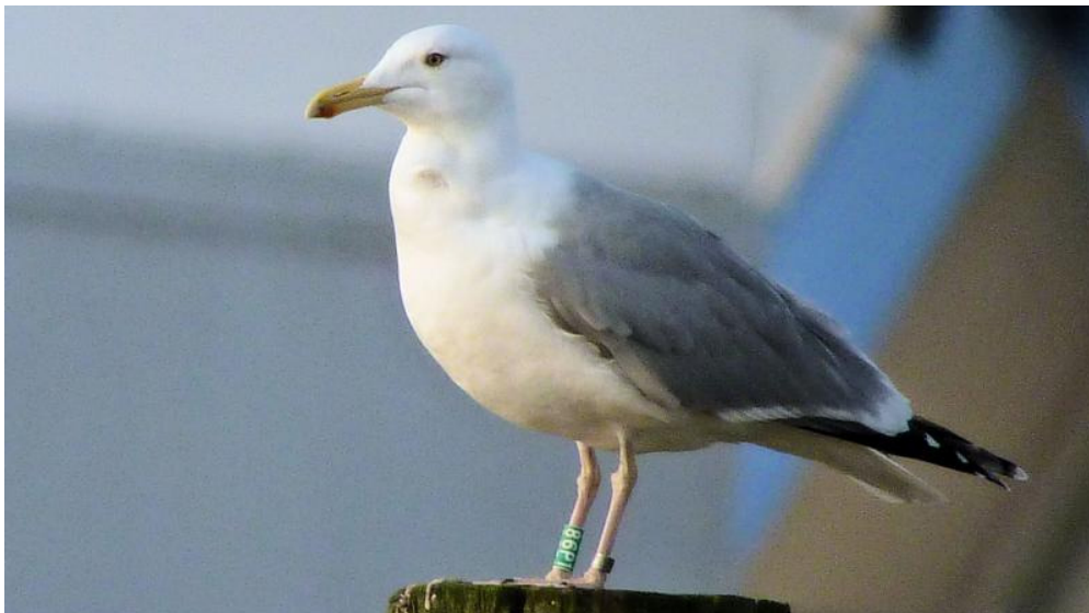
Figuur 17. Hybride Zilvermeeuw x Pontische Meeuw, adult, Lauwersoog, 28 januari 2012. Hybrid Herring x Caspian Gull, Lauwersoog (The Netherlands), 28 January 2012. Green 86P1 (Gdansk DN 13659) ringed as chick in a mixed colony near Włocławek (Poland) on 18 May 2006.