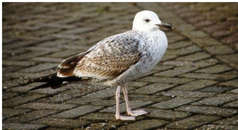
Figuur 6. Pontische Meeuw, eerste winter, Lauwersoog, 25 december 1999. First-winter Caspian Gull at Lauwersoog (The Netherlands), 25 December 1999.

Uit waarnemingen op lauwersmeer.com en op avifaunagroningen.nl valt op te maken dat vanaf 2000 jaarlijks regelmatig Pontische Meeuwen in en rond havens in Noord-Nederland worden gezien en gefotografeerd, met flink wat waarnemingen in Lauwersoog (Fig. 6) en in de Eemshaven. Ook bij Termunten worden al langere tijd regelmatig Pontische Meeuwen gezien. Gefotografeerde gevallen van voor die tijd zijn onder andere een eerste winter op 5 oktober 1994 in Lauwersoog (Grauwe Gors 23: 29, pas veel later herkend), een subadult in begin augustus 1995 op Vlieland (Versluys et al. 2002, Dutch Birding 21: 319) en een eerste winter op 16 mei 1999 in de haven van West-Terschelling (Versluys et al. 2002). Langs het Noordzeestrand van de Waddeneilanden worden eveneens regelmatig Pontische Meeuwen gezien. Voor Ameland bedraagt het maximum zes (30 december 2011, 1 tweede winter, 1 derde winter en 4 adult, Martijn Bot, langsvliegende vogels), voor Terschelling vier (22 december 2008, allen adult, Jaap Vink) en voor Vlieland drie (17 januari 2009, Leon Kelder).