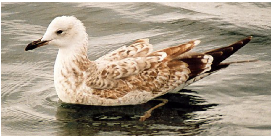
Figuur 1. Pontische Meeuw, eerste winter, Noordzee ten noorden van Ameland, 21 september 2002. First-winter Caspian Gull at the Dutch part of the North Sea, 21 September 2002.

Noord-Nederlandse vogelaars hebben jarenlang pelagische dagtochten georganiseerd naar de Noordzee ten noorden van Ameland en Schiermonnikoog. In de meeste jaren ging het om één tocht per jaar en globaal werd steeds hetzelfde gebied bezocht als tijdens de tochten vanuit Lauwersoog met Pterodroma Adventures (Fig. 6 in Van Bemmelen & Stegeman 2011). Tijdens de tocht van 21 september 2002 zagen we geruime tijd een Pontische Meeuw achter en naast de boot (Fig. 1). We voeren toen op ca. 15 km ten noorden van het oostelijk deel van Ameland, in de omgeving van 53°37'N; 05°57'O. Tijdens de tocht van 17 september 2006 zagen we eveneens een Pontische Meeuw (gefotografeerd, foto op lauwersmeer.com ). Ook tijdens de tocht van 6 oktober 2007 werd een vogel gezien (Mark Broeckert) en tijdens de tocht van 14 september 2008 werden twee vogels gezien (Fig. 2-3). Verder werd op 15 september 2004 tijdens een tocht voor de kust van Scheveningen een vogel gezien die langdurig achter de boot zat (Vincent van der Spek, gefotografeerd) en op 29 september 2007 werd een vogel gezien tijdens een tocht voor de kust van Walcheren (Fig. 4). In alle zeven gevallen ging het om een eerste winter vogel.