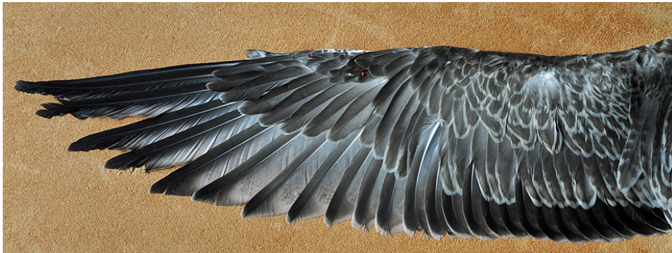
Figuur 8. Pontische Meeuw, eerste winter, Vlieland, 14 juli 2010. First-winter Caspian Gull at Vlieland (The Netherlands), found dead on 14 July 2010. Yellow PDSZ (Gdansk DN 18695) ringed as chick near Paczków (Poland) on 27 May 2010 (Kees Camphuysen).

als nestjong geringd bij Paczków (50°29'N; 16°58'O), in Zuidwest-Polen. De vondst van een vers dode eerste winter met geel PDSZ (Fig. 8) op 14 juli 2010 op het Noordzeestrand van Vlieland geeft aan dat jongen al vlot na het uitvliegen flinke afstanden kunnen afleggen (890 km WNW van de ringplaats). Een tweede geval van een dode vogel op Vlieland is de vondst op 9 augustus 2012 van geel PKTU op het badstrand (Gdansk DN 28725, geringd als nestjong bij Paczków op 25 mei 2012). Alleen de kleurring werd verzameld en de identificatie als (raszuivere) Pontische Meeuw is dus niet zeker (zie box 1).