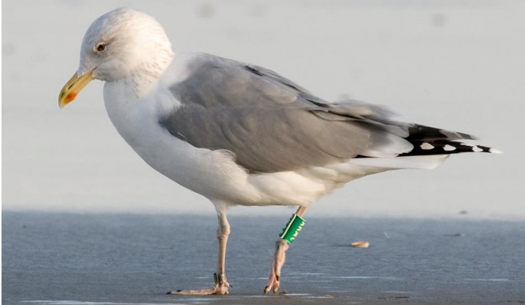
Figuur 16. Hybride Zilvermeeuw x Pontische Meeuw, adult, Noordzeestrand Terschelling, 12 november 2012. Hybrid Herring x Caspian Gull, Terschelling (The Netherlands), 12 November 2012. Green XKAC (Hiddensee EA 126.797) ringed as chick in a mixed colony in the Lausitz (Germany) on 10 June 2003 (Jaap Vink).

november en op 15 december (ook gefotografeerd) zat hij weer op het Noordzeestrand van Terschelling. In 2013 zat groen XKAC in een kolonie langs de Nederrijn bij Amerongen. De vogel, een vrouwtje, was gepaard met een Geelpootmeeuw en heeft hier succesvol gebroed. Op 21 mei werden beide vogels op het nest gevangen (PieterGeert Gelderblom).