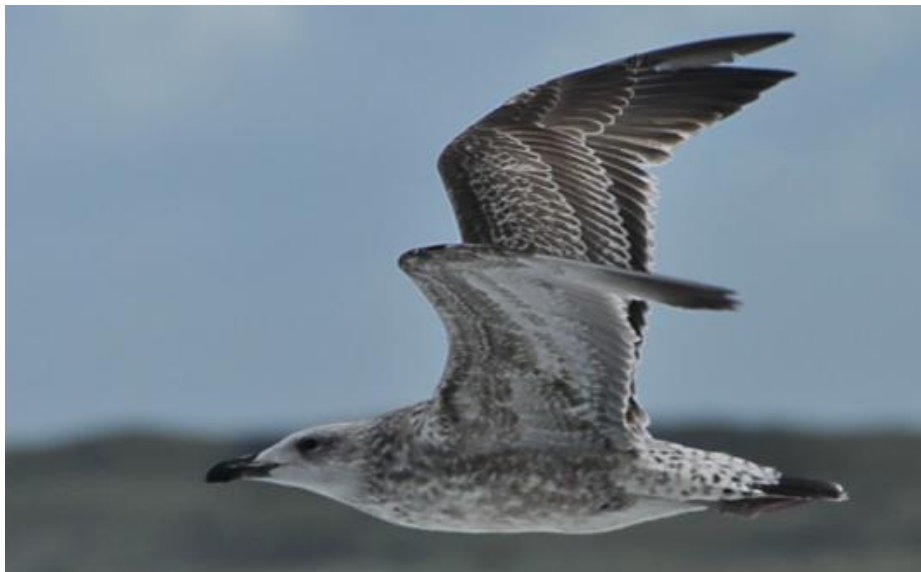
Figuur 15. Ongeïdentificeerde grote meeuw, eerste winter, strand bij Scheveningen, 8 oktober 2011. Unidentified large gull from the Herring Gull Group, first winter, Scheveningen (The Netherlands), 8 October 2011. Yellow PHHS (Gdansk DN 27225) ringed as chick near Paczków (Poland) on 26 May 2011.

Het eerste voorbeeld is geel PHHS, gezien bij Scheveningen op 8 oktober 2011 (Fig. 15). De vogel werd toen geïdentificeerd als een hybride met verschillende kenmerken die passen bij Geelpootmeeuw. Twee maanden later, op 12 december 2011, zat de vogel op het strand bij Noordwijk bij paal 73 (25 km NO van Scheveningen). Hij werd toen als Zilvermeeuw genoteerd. Daarna is hij driemaal (op 2 en 25 januari en op 20 februari 2012) in de Starrevaart (bij Voorschoten) gezien, maar steeds benoemd als Pontische Meeuw. Op het terugmeldformulier staat " Caspian Gull colony Larus cachinnans kolonia ", maar dat houdt dus niet in dat het dan een (raszuivere) Pontische Meeuw moet zijn. Al kan dat wel.