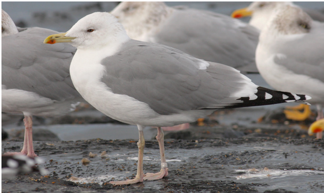
Figuur 12. Pontische Meeuw, adult, Westkapelle, 11 november 2008. Adult Caspian Gull at Westkapelle (The Netherlands), 11 November 2008. Kiev T 001093, ringed as chick near Kaniv (49°46'N; 31°28'E, Ukraine) on 27 May 2004 (Thomas Luiten).

Bij Westkapelle zijn zeker vier vogels gezien die in de Oekraïne waren geringd. Alle vier waren ze als nestjong geringd in een binnenlandkolonie langs de Dnjepr bij Kaniv, 350 km noord van de Zwarte Zee en 1980 km oost van Westkapelle. In deze kolonie worden jaarlijks forse aantallen geringd (3409 in 1997-2006, Grishchenko et al. 2006). Bij Westkapelle ging het om Kiev L 000992 (geboren in 1999, gezien op 19 december 2000), om Kiev L 004547 (geboren in 2002, gezien op 16 juli 2004 en op 4 oktober 2004), om Kiev T 001093 (Fig. 12, ook gezien op 5 november 2008) en om Kiev T 001380 (Fig. 13, ook gezien op 9 en 11 november 2008). In 2010 zat de vogel op 23 september en op diverse dagen tussen 14 en 28 oktober bij Westkapelle, maar op 2 oktober in Oostende (België, gefotografeerd), ruim 45 km naar zuidwest. Verder zijn bij Westkapelle verschillende vogels gezien die in Polen waren geringd. Een voorbeeld is een tweede winter met geel PHNN (Gdansk DN 27518, geringd in 2011 als nestjong bij Paczków). De vogel werd eerst gezien in achtereenvolgens Rotterdam (29 januari), de Biesbosch (7 mei) en Groningen-stad (10 juli), alvorens op de avond van 21 november op te duiken bij Westkapelle (net binnendijs). Vervolgens zat hij vanaf 7 december in en rond Dordrecht.